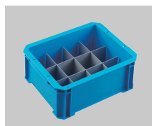
⑤ 薬品整理箱 (500ml用 12本立)